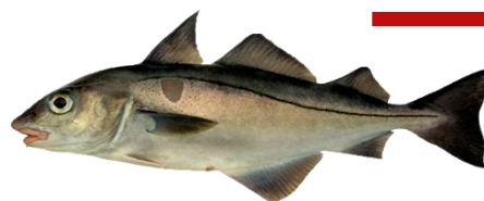
Provenance des débarquements français d'Églefin en 2020