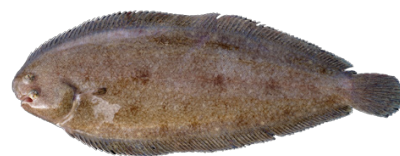
Provenance des débarquements français de Sole Commune en 2020