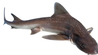
Provenance des débarquements d'Émissoles en France en 2020