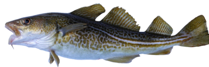
Provenance des débarquements français de Cabillaud en 2020