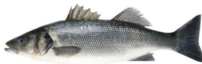
Provenance des débarquements français de Bar Atlantique en 2020.