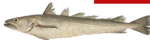
Provenance des débarquements français de Merlu Européen en 2020